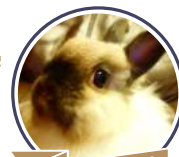
くーちゃん / 10歳

2008年10月12日に生まれてから、毎日欠かさず食べてきた乳酸菌です。今思えば色々な失敗もありました。でも、私が間違えたことをしなければ、常に健康なうんちをしてくれる子です。まだまだ元気に、食欲もうんちも絶好調。この子のお父さんも同じ乳酸菌を食べて14歳まで長生きしました。