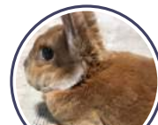
プリンちゃん / 8歳

換毛期は特に鬱滞を起こしやすかったんですが、「うさぎの乳酸菌」を食べるようになってから糞が大きくなりました。換毛期や夏でも食欲が安定しており8歳という年齢にも関わらず毎日元気に部屋んぼをしています。味も美味しい様でオヤツ代わりになるので一石二鳥です。