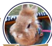
みみ君 / 9歳

5歳頃から年2回の換毛期に毎回うっ滞をおこすようになり、我が家のうさぎのみみ君も飼い主とても苦しい日々を送っていました。7歳で腫瘍除去の手術を行うにあたって転院をし、そこで先生の指導のもとおやつと牧草の量の見直しをしました。その時におやつで勧められたのが乳酸菌でした。その後「うさぎの乳酸菌」をおやつにメインに変えたところうっ滞に一度もなっていません。うさぎの乳酸菌は美味しく健康にいいおやつのみみ君にも飼い主にも欠かせないものとなり、なによりみみ君が健康で過ごせていて大変助かっています。ありがとうございます。