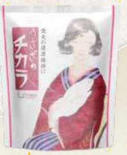
うさぎのチカラ 120錠入り