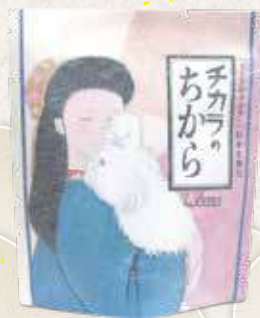
チカラのちから 80錠入り