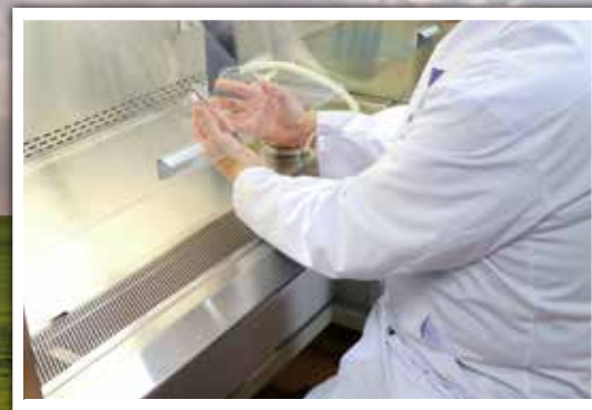
日本獣医生命科学大学のラボ

4年以上にも渡った緻密な研究の成果によって生み出された「うさぎ由来の乳酸菌LM-WOOLY株」は、総合栄養食「ブルームラボシリーズ」の主要素材として採用されています。