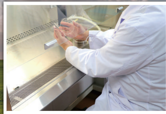
日本獣医生命科学大学のラボ

4年以上にも渡った緻密な研究の成果によって生み出された「うさぎ由来の乳酸菌LM-WOOLY株」は、総合栄養食「ブルームラボシリーズ」の主要素材として採用されています。